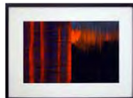
Marie-Jo Lafontaine © Courtesy of the Artist