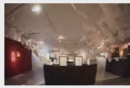
Exposition Verlaïne

Pour terminer l'année 2015, le Pôle muséal de la Ville de Mons s'associe à la Bibliothèque royale de Belgique pour plonger les visiteurs du BAM dans l'histoire de Verlaïne et de la Belgique. Cette tentative de « roman épique » sous forme d'exposition vous emmène dans un « cheminement Verlaïne » à travers l'homme et ses textes, à partir de nombreux documents originaux et exceptionnels. De la dispute entre Arthur Rimbaud et Paul Verlaïne au coup de feu qui fut à l'origine du procès judiciaire à l'encontre de ce dernier, en passant par la prison de Mons où Verlaïne séjourna, l'exposition rend à ce poète